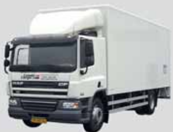
Bakwagens, Rijbewijs cat. C

Eigen Risico W.A.: € 1.000,- / Casco € 1.000,-