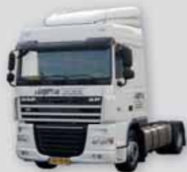
Trekkers, Rijbewijs cat. CE

Dagprijs is incl. eurovignet. De bakwagens zijn er in diverse uitvoeringen zoals slaapcabine, schuifzeilopbouw en een vangmuilkoppeling. Handgeschakeld en automatisch beschikbaar.